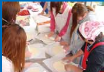
熊本キャンパスはピザの調理体験

平成22年度の行事を振り返って、一つ葉高校の活動をご報告したいと思います。入学式・始業式を終えて間もなく、各キャンパスでは遠足を行いました。代々木・立川の両キャンパスは合同で京王よみうりランドへ行きました。同じく遊園地を選んだのは小倉キャンパスです。こちらは北九州市のスペースワールドへ行きました。少し違った遠足を体験したのは熊本キャンパスです。農業への理解をテーマに設立された熊本農業公園カントリーパークを目的地に選び、ピザやバームクーヘンなどの調理体験とともに、自然の中で体を動かして楽しんだ一日でした。あいにくの雨にたたられたのは福岡キャンパスです。それでも体育館でバドミントン大会を行って元気に体を動かしました。