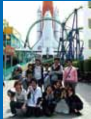
スペースワールド

前期スクーリングは5月19日・20日の2日間で行いました。今回のスクーリングで最も印象深かったのは、やはり田植えの体験でした。米を主食としながら我々の多くが日ごろ体験することのない貴重な機会であるとともに、本校周辺の住民の方が田んぼを提供してくださり指導にあたってくださったことが何よりありがたいことでした。一つ葉高校の生徒達と我が子我が孫のように接して下さる姿にはただただ頭が下がります。今後もこのような形で、地域の暮らしぶりや伝統に接する機会を作りたいものです。生徒達はこちらの予想を上回るほど田植えを楽しく感じてくれたようです。あいにくの天気の中でしたが、泥だらけになりながら協力して丁寧に1本1本を植えていきました。